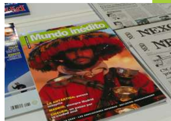
La revista en la Exposición