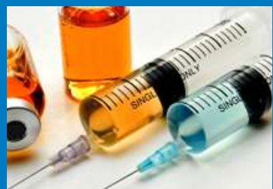
Vacunaciones necesarias Inmunizaciones recomendadas Quimioprofilaxis