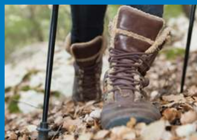
Ropa y calzado adecuado