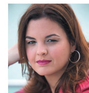
Sandra Gómez Primera Teniente de Alcalde del Ayuntamiento de València. Presidenta de la Fundación Turismo Valencia

Finalizo reiterando mi agradecimiento por elegir Valencia para esta reunión y permitimos mostraros en primera persona cómo es el turismo en la Comunitat y especialmente, cómo es el turismo en esta maravillosa ciudad.