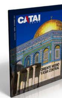
ORIENTE MEDIO Y ASIA CENTRAL