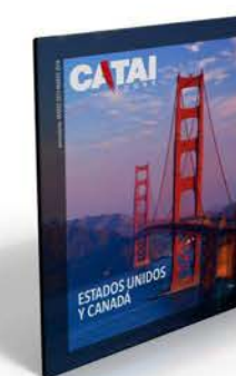
ESTADOS UNIDOS Y CANADÁ