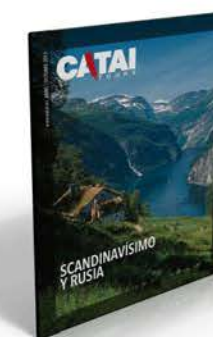
SCANDINAVÍSIMO Y RUSIA